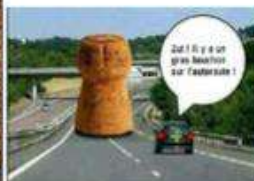
et aujourd'hui !