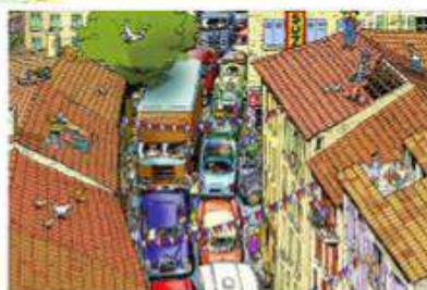
Les années 60 : la RN 7 avant l'autoroute...